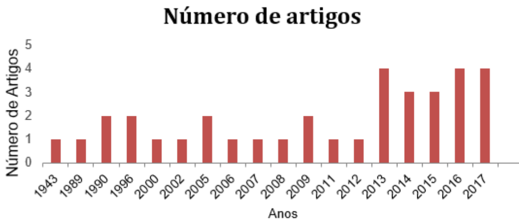
Figura 1 - Número de trabalhos relacionados a Terapia Assistida por Animais dos anos de 1943 - 2017.

Entre os anos analisados (1943 a 2017) foi encontrado um maior número de trabalhos publicados entre os anos de 2011 e 2017, o que demonstra que o tema é recente, devido a um contínuo crescimento das publicações (Figura 1)